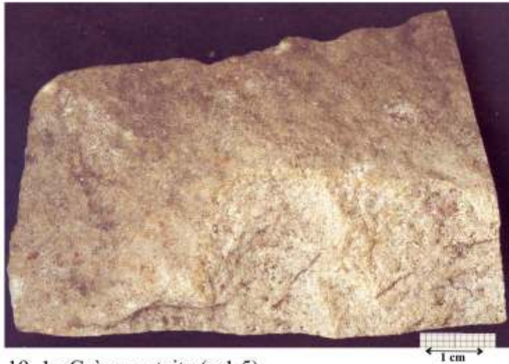
19_1 : Grès quartzite (x 1.5)