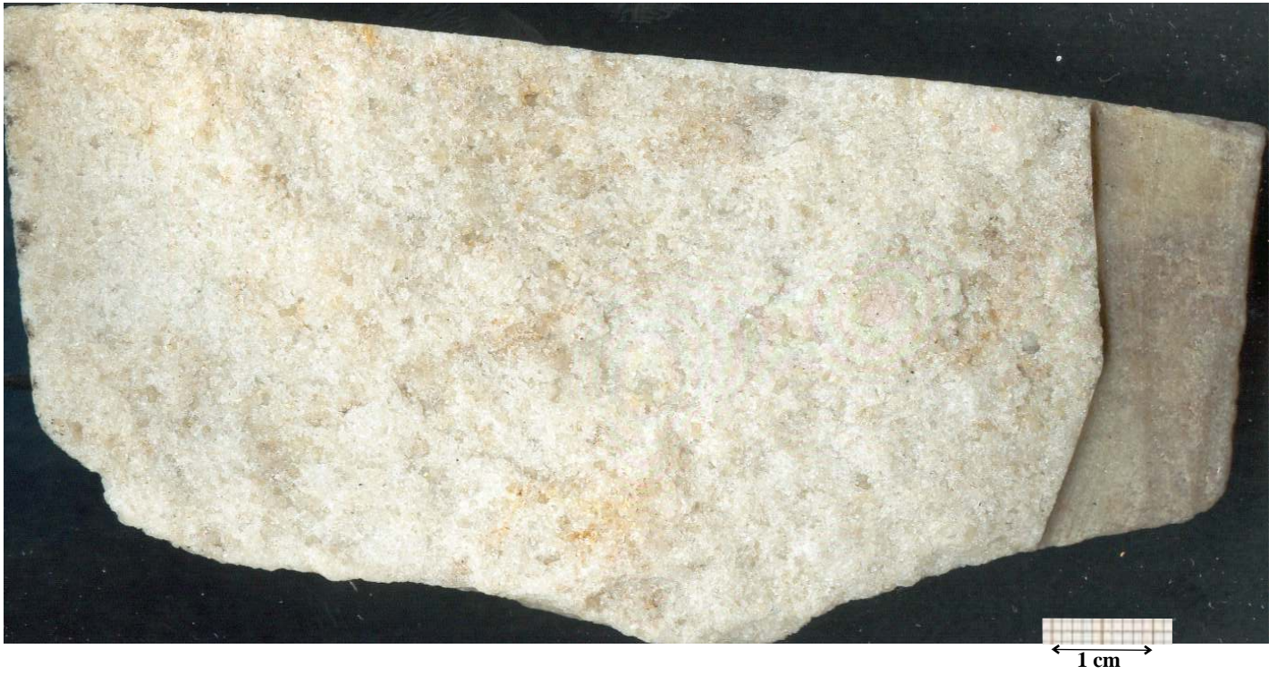
21_1 : Grès quartzite (x 1.5)